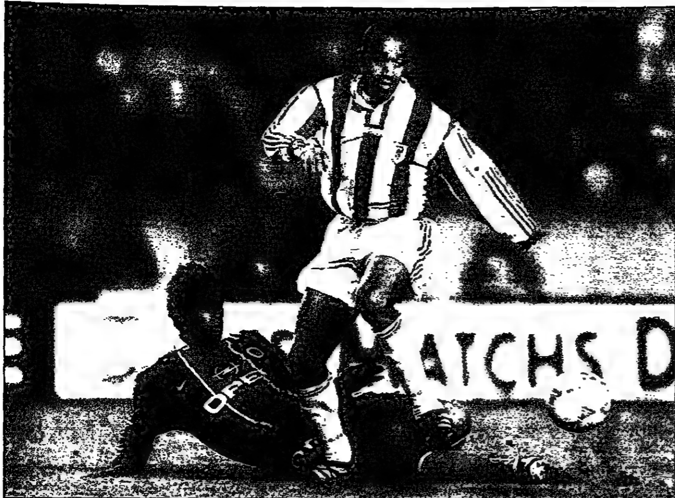
جان جاك ابرام لاعب كان وفاق، وراي لاعب باريس سان جيرمان سقط أرضاً في مباراة فريقهما